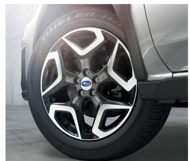
18" легкосплавные диски