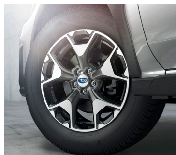
17" легкосплавные диски