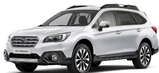
Белый перламутр (Crystal White Pearl)