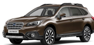
Коричневый перламутр (Oak Brown Pearl)