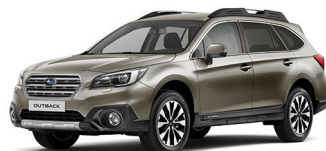
Бежевый металл (Tungsten Metallic)