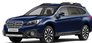
Темно-синий перламутр (Dark Blue Pearl)