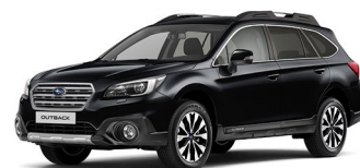
Черный металл (Crystal Black Silica)