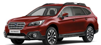
Красный перламутр (Venetian Red Pearl)