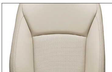
Кожа цвета слоновой кости