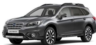
Темно-серый металл (Dark Gray Metallic)