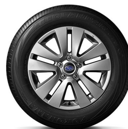
17" легкосплавные диски