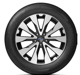
18" легкосплавные диски**